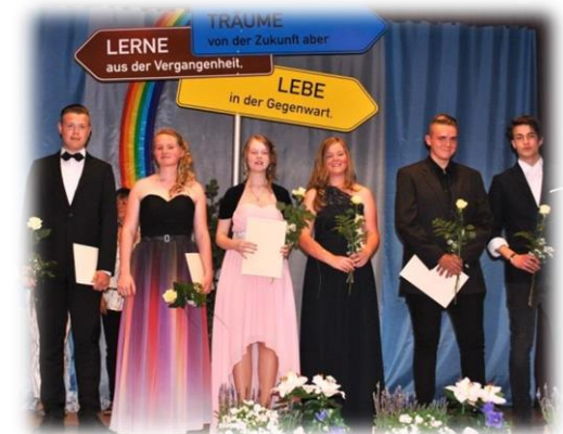
feierliche Zeugnisübergabe und Ehrung von besonderen Leistungen

Einweihung des Neubaus der Grundschule „Am Ohmgebirge“ und Beginn des Unterrichts in dem neuen Gebäude, das unmittelbar mit der Regelschule verbunden ist.