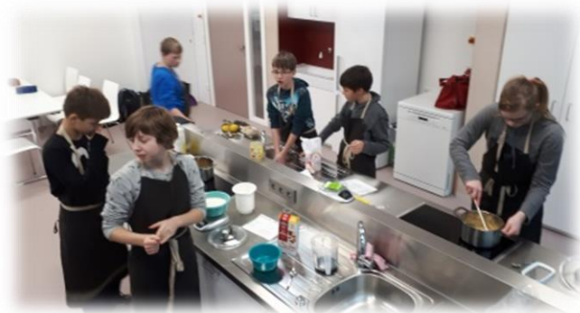
Blick in unser Hauswirtschaftskabinett

Die vom Schulträger dafür bereit gestellten finanziellen Mittel decken dabei nur den Grundbedarf ab. Gerade die Kleinigkeiten sind es jedoch, die den Schulalltag oft erleichtern. Hier kann der Förderverein meist schnell und unbürokratisch helfen.