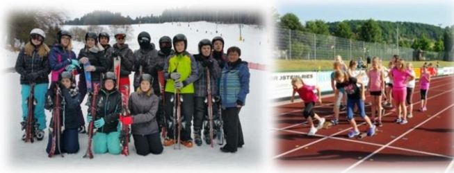
Skilager und Sportfest